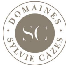
TABLE DU BIEN-MANGER depuis 1895