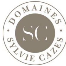
TABLE DU BIEN-MANGER depuis 1895